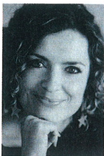
AF CHEFREDAKTØR CAMILLA KJEMS ADRESSELISTE SIDE 148